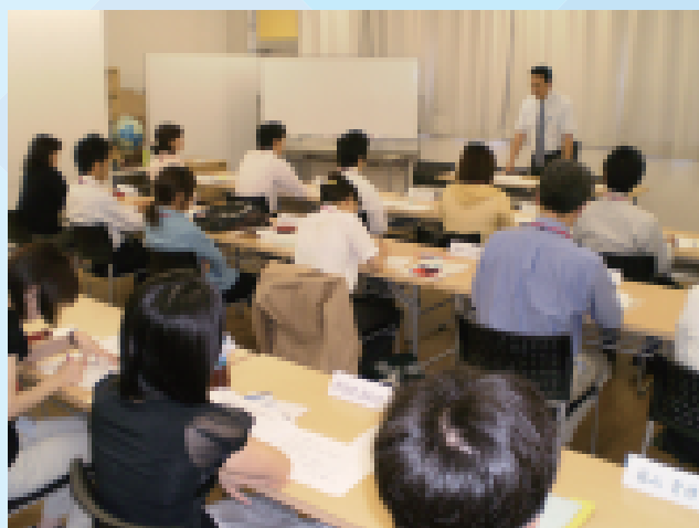
事業開発に関する座学研修