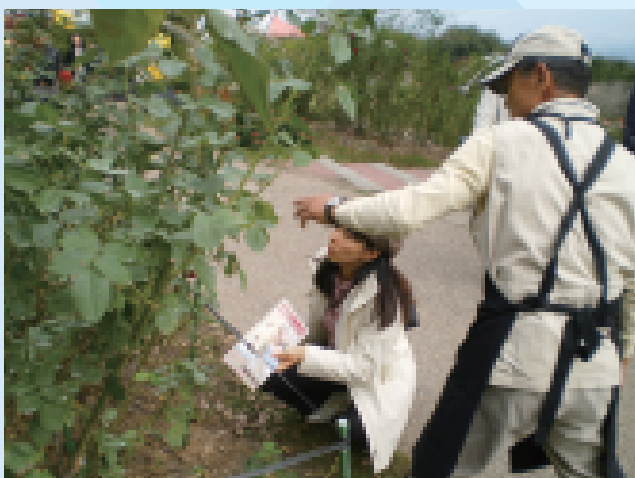
実地視察・現場実習