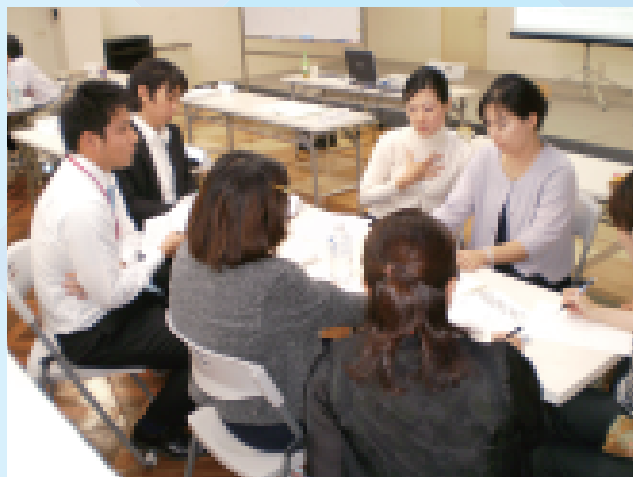
基礎的ビジネススキルの習得