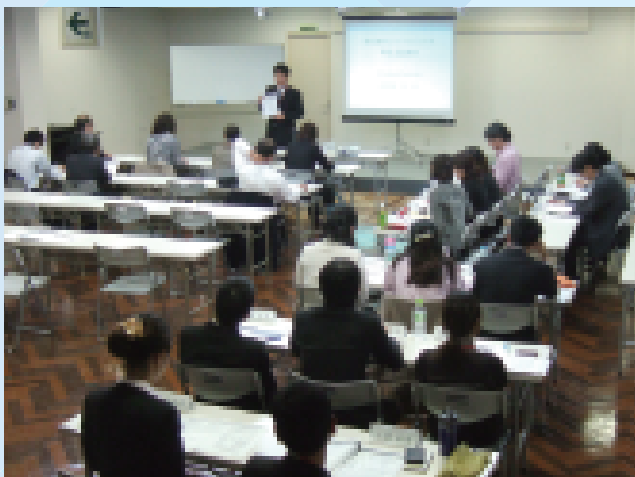
事業計画の作成およびプレゼンテーション